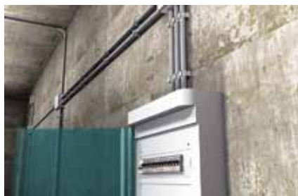
Fissaggio tubi in PVC